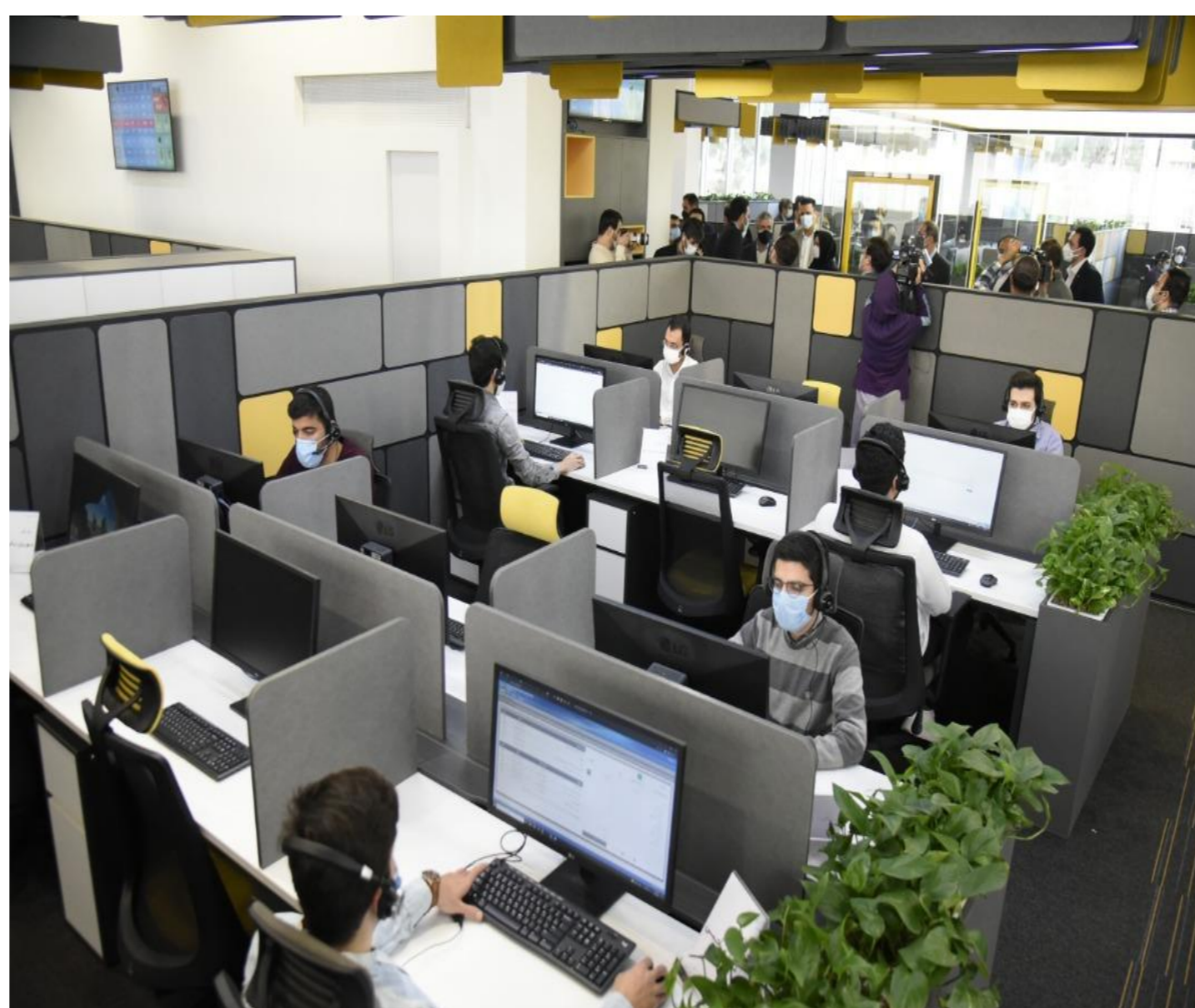
شکل ۲ نمای داخلی بخش مرکز تماس